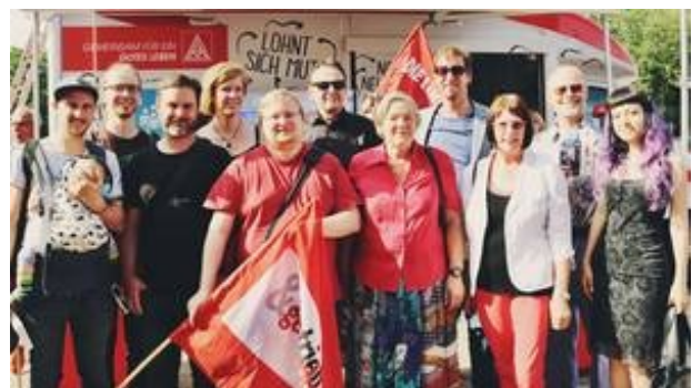
Kreisverband LINKE Wiesbaden mit etwa 30 Aktiven und Stadtverordneten dabei