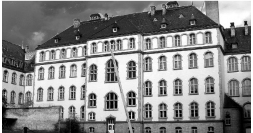
Dunkle Wolken über der EBS, die mit Millionen durch die Stadt Wiesbaden „gefördert“ wird.

Dies zeigt sich beispielsweise bei einem so wichtigen Thema wie Schulsanierungen, wo sich CDU und SPD in ihrem Koalitionsvertrag mit der Feststellung begnügten, es werde eine Prioritätenliste vorgelegt, was das Stadtparlament vor Monaten längst beschlossen hat und die dann viele Monate auf sich warten lässt. Zur Finanzierung fällt ihnen nichts anderes ein, als dass die Veräußerung von Schulgrundstücken möglich sein sollte. In welcher Größenordnung sie Geld für die dringend nötigen Schulsanierungen bereitstellen wird und wo das herkommen soll, darüber schweigt sich die Koalition aus. Es sei absurd, dass in einer reichen Stadt wie Wiesbaden Kinder und Jugendliche weiter in maroden Schulen lernen müssten, nicht ausreichend Geld für Schulsozialarbeit und