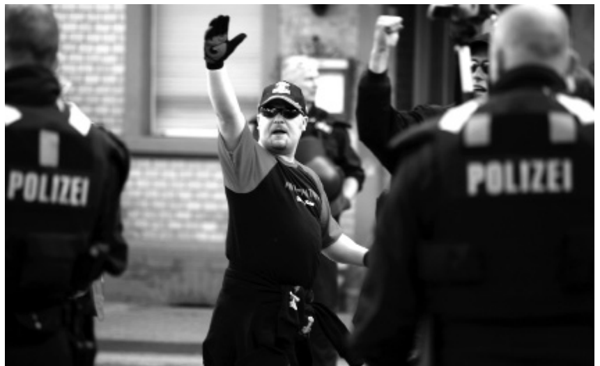
Neonazi-Aufzug in Erbenheim am 8. Mai 2010.

Breite Gegenöffentlichkeit setzt die Kenntnis über ein bevorstehendes Ereignis voraus. Innerhalb von weniger als 24 Stunden ist es gelungen rund 150 Gegendemonstrantinnen und -demonstranten zu einer Gegendemonstration zu mobilisieren, darunter auch einige linke, grüne und sozialdemokratische kommunale Mandatsträgerinnen und -träger und Landtagsabgeordnete – ein gutes Zeichen für Wiesbaden! Vor allem die mangelnde Informationspolitik seitens der Stadtregierung ist dafür verantwortlich, dass es nicht mehr waren.