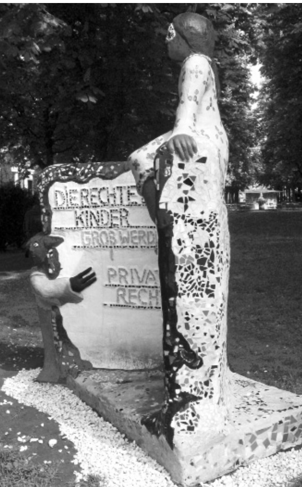
Figur auf dem Kinderspielpaltz in der Adolfsallee

School (EBS) über einen warmen Geldregen aus der Stadtkasse freuen.