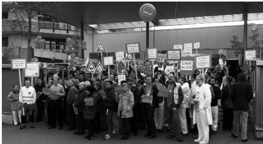
Die HSK-Belegschaft lässt sich nicht (für dumm) verkaufen.

Und auch dass Privatisierung selten funktioniert, wissen die HSK-Beschäftigten aus Erfahrung. 2002 übernahm der Dussmann-Konzern 49 Prozent der Anteile an der Tochter HSK-Service GmbH mit Küche, Reinigung oder Wäscherei. Bald häuften sich Klagen über eine schlechte Qualität der Reinigung. Dussmann flog raus und die HSK-Service GmbH übernahm wieder zu 100 Prozent. „Privatisierung ist kein