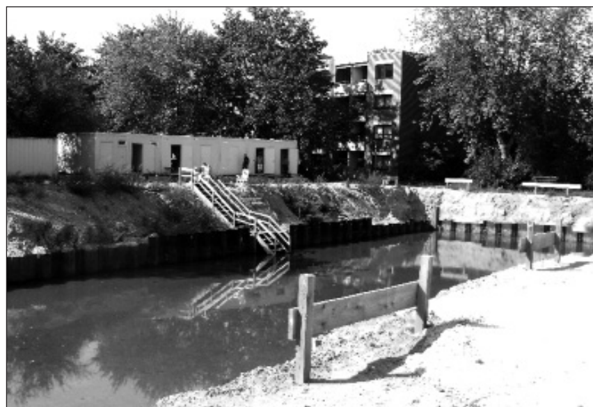
Wegen des monatelangen Baustopps hatte sich im Bodentrichter zwischenzeitlich ein Teich gebildet